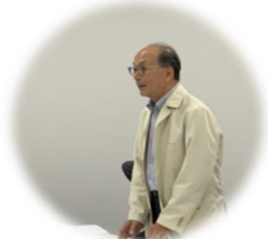
【佐藤公司 協会会長】